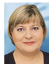
Helga Kühne-Mengel, MdB

Im Dezember hat die Bundesregierung die erste Patientenbeauftragte berufen. Helga Kühne-Mengel soll die Rechte der Patienten auf Bundesebene vertreten. Fragen an die Patientenbeauftragte können im Internet unter info@die-patientenbeauftragte.de gestellt werden. Telefonische Anfragen sind unter 0 18 88 441 34 20 möglich. Ein telefonischer Kontakt erweist sich nach Recherchen der Deutschen Hospiz Stiftung jedoch als äußerst schwierig, da die Leitungen sehr oft überlastet zu sein scheinen. Der Service für Patienten scheint demnach für die Patientenbeauftragte wenig Priorität zu haben.